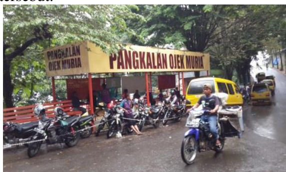
Gambar 2. Kelompok Ojek Wisata

Berdasarkan hasil survei lapangan, teridentifikasi Kelompok usaha ojek wisata yang ada di Desa Colo yaitu sebanyak 1.200 anggota yang tersebar secara merata. Kelompok ojek sendiri menjadi salah satu kelompok yang aktif memiliki kegiatan pertemuan rutin. Selain itu, kelompok ojek wisata ini telah berkontribusi dalam penyediaan transportasi menuju lokasi destinasi wisata yang sulit untuk dijangkau dengan menggunakan kendaraan besar. Hal ini dikarenakan kondisi lokasi menuju destinasi wisata memiliki kelerengan yang cukup terjal, sehingga akan sulit bagi pengunjung yang menggunakan kendaraan besar untuk menjangkau destinasi wisata tersebut.