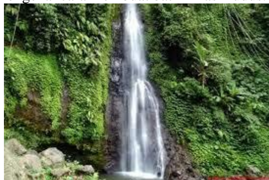
Gambar 1. Daya Tarik Wisata Alam

memberikan pengetahuan kepada wisatawan mengenai cara membuat batik khas Kudus.