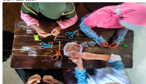
Gambar 1. Peserta didik sedang membuat produk “Gelangku”.

Setelah tahap pelaksanaan selesai, selanjutnya observasi dilakukan dengan mengamati hasil angket yang sudah dilaksanakan sebelumnya. Nilai sikap kemandirian peserta didik yang diperoleh dari hasil angket tersebut menunjukkan peserta didik memiliki nilai sikap kemandirian sebesar 31,42%. Nilai tersebut masuk dalam kategori cukup, namun belum mencapai indikator keberhasilan yang diharapkan dalam penelitian. Adapun proses pembuatan gelang pada Siklus I dapat dilihat pada gambar di bawah ini: