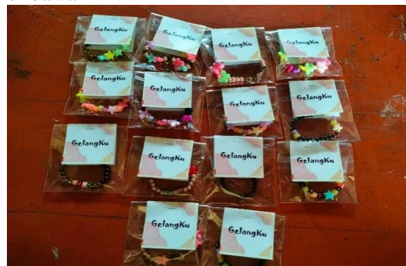
Gambar 4. Produk “Gelangku” hasil karya kelas 5 yang telah dijual.

produk yang telah dijual siswa, seperti gambar di bawah ini: