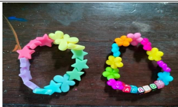
Gambar 2. Produk pada Siklus I dan Siklus II.

Setelah dilakukan observasi tindakan Siklus II, ternyata hasil menunjukkan peningkatan nilai sikap kemandirian peserta didik sebesar 72,14%. Nilai sikap kemandirian tersebut masuk ke dalam kategori baik. Peningkatan yang cukup drastis mengingat pada pelaksanaan tindakan Siklus II peneliti fokus kepada indikator yang belum tercapai, dan memperbaiki Siklus II pada setiap tahapnya. Kekurangan pada tindakan Siklus II ini adalah pada pembuatan produk gelang yang dibuat dengan mote huruf, peserta didik bingung dalam mengaplikasikan nama karena keterbatasan mote yang dibeli dengan huruf acak. Kelebihannya adalah peserta didik dapat fokus pada proses pembelajaran dan pembuatan produk karena waktu yang terencana dengan baik. Nilai sikap kemandirian meningkat karena proses Siklus II lebih terencana dengan baik, serta peminat produk lebih banyak karena bisa membeli produk dengan melakukan kustomisasi sesuai nama masing-masing. Adapun contoh hasil produk karya siswa pada Siklus I dan II dapat dilihat pada gambar di bawah ini: