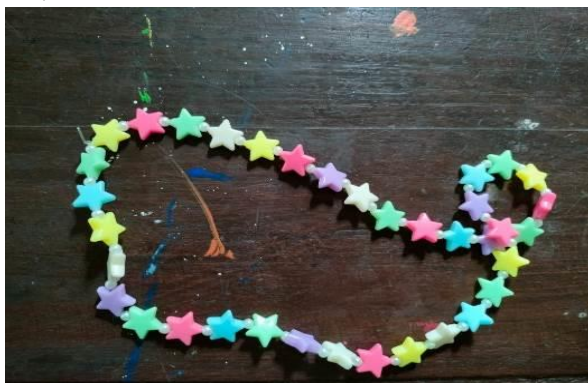
Gambar 3. Contoh produk pada Siklus III.

Di sisi lain, peneliti fokus pada observasi serta tindakan selanjutnya untuk dapat mencapai semua indikator sikap kemandirian yang diberikan dan sukses dalam penelitian. Sedangkan contoh produk karya siswa pada siklus III dapat dilihat pada gambar di bawah ini: