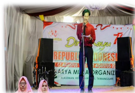
Sumber: Foto Peneliti (27 Agustus 2022)