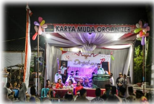
Gambar 6 (27 Agustus 2022)

Berdasarkan pidato sambutan ketua panitia (Dimas) menunjukkan bahwa dalam rangka memperingati kemerdekaan RI, warga masyarakat tidak mudah terpengaruh dengan berita bohong ( hoax ) terutama di media sosial, karena hal tersebut membuat warga terpecah belah atau menimbulkan konflik. Persatuan dan kesatuan adalah hal yang sangat penting dan harus diimplementasikan di dalam kehidupan sehari-hari.