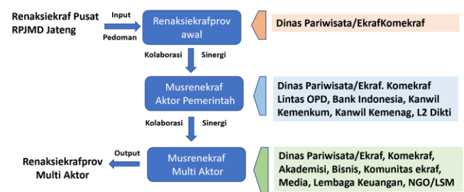
Gambar 2. Tahapan Penyusunan Renaksiekrafprov

bukan hanya sekedar wacana tetapi menjadi aksi nyata semua stakeholder. Selain itu capaian indikator kinerja utama ekonomi kreatif yang menjadi target pusat dalam hal investasi dan ekspor yang dibarengi dengan target Provinsi Jawa Tengah untuk mencapai proporsi 12,6% dari nilai PDB ekonomi kreatif nasional dan capaian jumlah tenaga kerja di sektor ekonomi kreatif dapat terwujud. Terwujudnya ekosistem akan mampu menciptakan kebutuhan lapangan pekerjaan terutama bagi generasi zilenial di Jawa Tengah sebagaimana harapan Gubernur Jateng. Berikut tahapan kegiatan penyusunan Renaksiekrafprov.