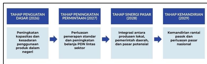
Gambar 2. Penahapan P3DN Jawa Tengah Tahun 2025-2029

berkelanjutan dalam memperkuat daya saing produk lokal serta kemandirian industri daerah.